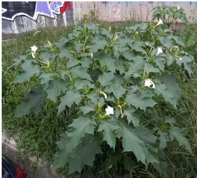
Slika 3. Datura stramonium L. (Tatula) ispred tržnog centra Merkator Picture 3. Datura stramonium L. (Jimson weed) in front of Mercator shopping center