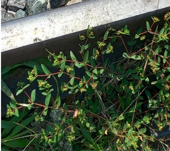
Slika 2. Euphorbia nutans Lag. (Njišuća mlječika) na željezničkoj pruzi u Hadžićima Picture 2. Euphorbia nutans Lag. (Nodding spurge) on the railway in Hadžići