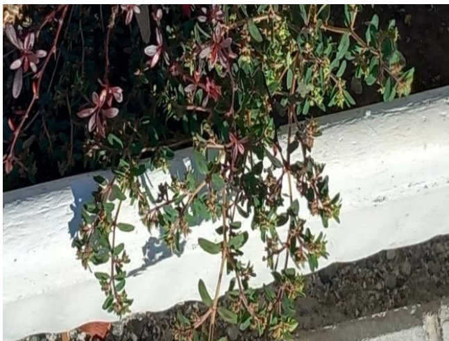
Slika 1. Euphorbia maculata L. (Pjegava mlječika) u žardinjeri ispred zgrade "Hitne pomoći"

Picture 1. Euphorbia maculata L. (Spotted spurge) in the planter in front of the ambulance building