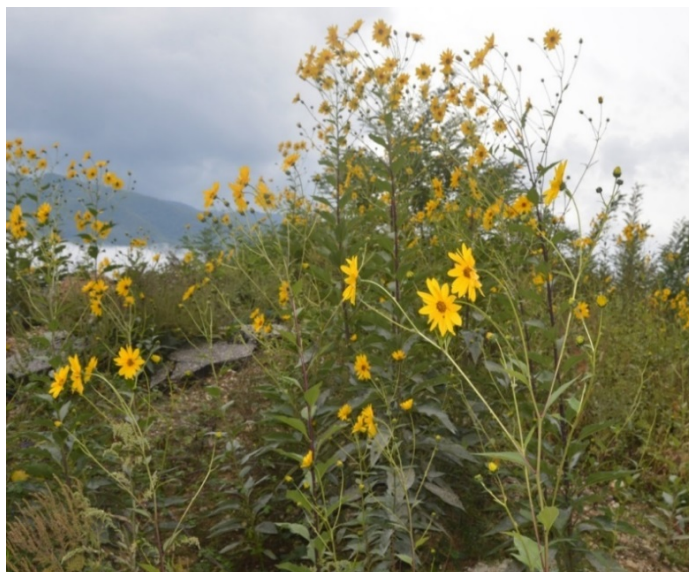
Slika 5. Helianthus tuberosus L. (Čičoka) pored puta za Lisičice Picture 5. Helianthus tuberosus L. (Jerusalem artichokes) by the road to Lisičići