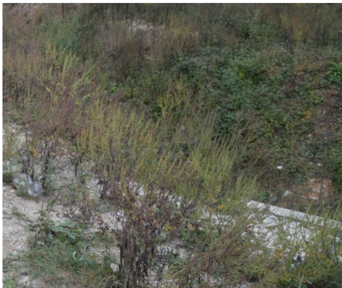
Slika 4. Ambrosia artemisiifolia L. (Limundžik) u blizini sela Lisičići-Konjic Picture 4. Ambrosia artemisiifolia L. (Ragweed) near village Lisičići-Konjic