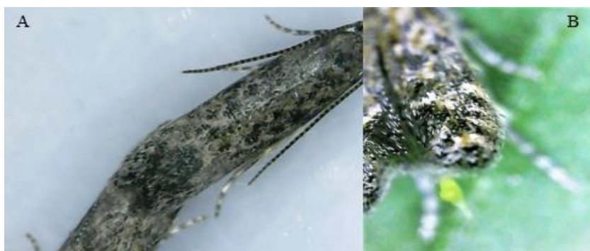
Slika 1. Moljac paradajza - kopulacija (A) i polaganje jaja (B) Fig.1 Tomato leaf miner - copulation (A) and egg laying (B)

polaganju jaja (slika 1). Na osnovu provedenih istraživanja uočeno je da ženka najveći broj jaja položi u prva 24 sata nakon kopulacije, najčešće polažući jedno po jedno, s tim da su najčešće jaja položena u manjim grupama od dva do pet jaja. Za polaganje jaja ženka traži listove bez mina, ali se položena jaja mogu naći i na listovima s već formiranim minama. Najčešće su jaja položena na lice lista, a rjeđe na naličje. Broj položenih jaja, odnosno plodnost ženke zavisi od mnogo faktora (Lee et al. , 2014), a naročito od dužine njenog života. Na promatranim parovima ženki izdvojenim u entomološkim kavezima, praćen je i broj jaja koje ženka položi nakon kopulacije tokom svog života. U provedenim istraživanjima utvrđeno je da ženke moljca paradajza polažu najčešće između 120 i 230 jaja. Na uzorku od 10 ženki utvrđeno je da ženka u prosjeku položi 173,2 jaja. Shiberu & Getu (2017), kao i Cuthbertson et al. (2013), navode da jedna ženka položi oko 260 jaja. Prema istraživanjima Erdogana & Babaroglua (2014), ženka u prosjeku položi 141,16 jaja. Prema drugim autorima, broj jaja koji položi jedna ženka moljca paradajza je jako varijabilan. Prema Torrest et al. (2001), plodnost ženke se kreće od 60 do 120 jaja, a Uchoa-Fernandes et al. (1995) navode da jedna ženka položi oko 260 jaja. Pereyra & Sanches (2006) utvrdili su da ženka u prosjeku položi 132,78 jaja.